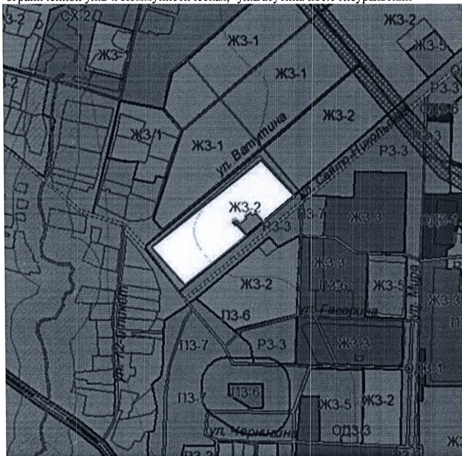
Рисунок 1 - Фрагмент карты градостроительного зонирования р.п. Углеуральский с границей проектируемой территории

Проект межевания территории площадью 2,54га, расположенной в кадастровом квартале № 59:05:0201006, ограниченной ул.2-я Коммунистическая, -ул.Ватутина пос.Углеуральский