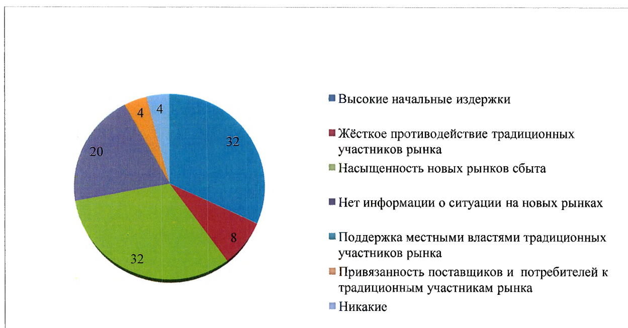
Диаграмма 3. Основные препятствия при выходе на новые рынки

В ходе анализа итогов опроса выявлено, что почти каждый субъект предпринимательской деятельности сталкивается с теми или иными видами административных барьеров. Среди основных административных барьеров наиболее существенными для ведения текущей деятельности или открытия нового бизнеса являются высокие налоги – 48%.